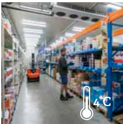
koelruimte cash & carry