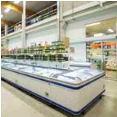
diepvries cash & carry

Door de grootte van de opslagruimte (meer dan 10.000 m 3 ) kunnen wij onze prijzen scherp houden.